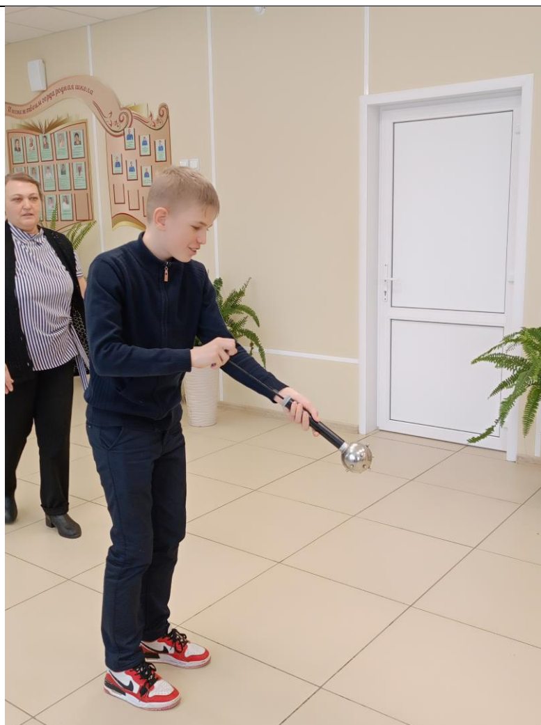
Изучение закона Паскаля с помощью ШАРА ПАСКАЛЯ