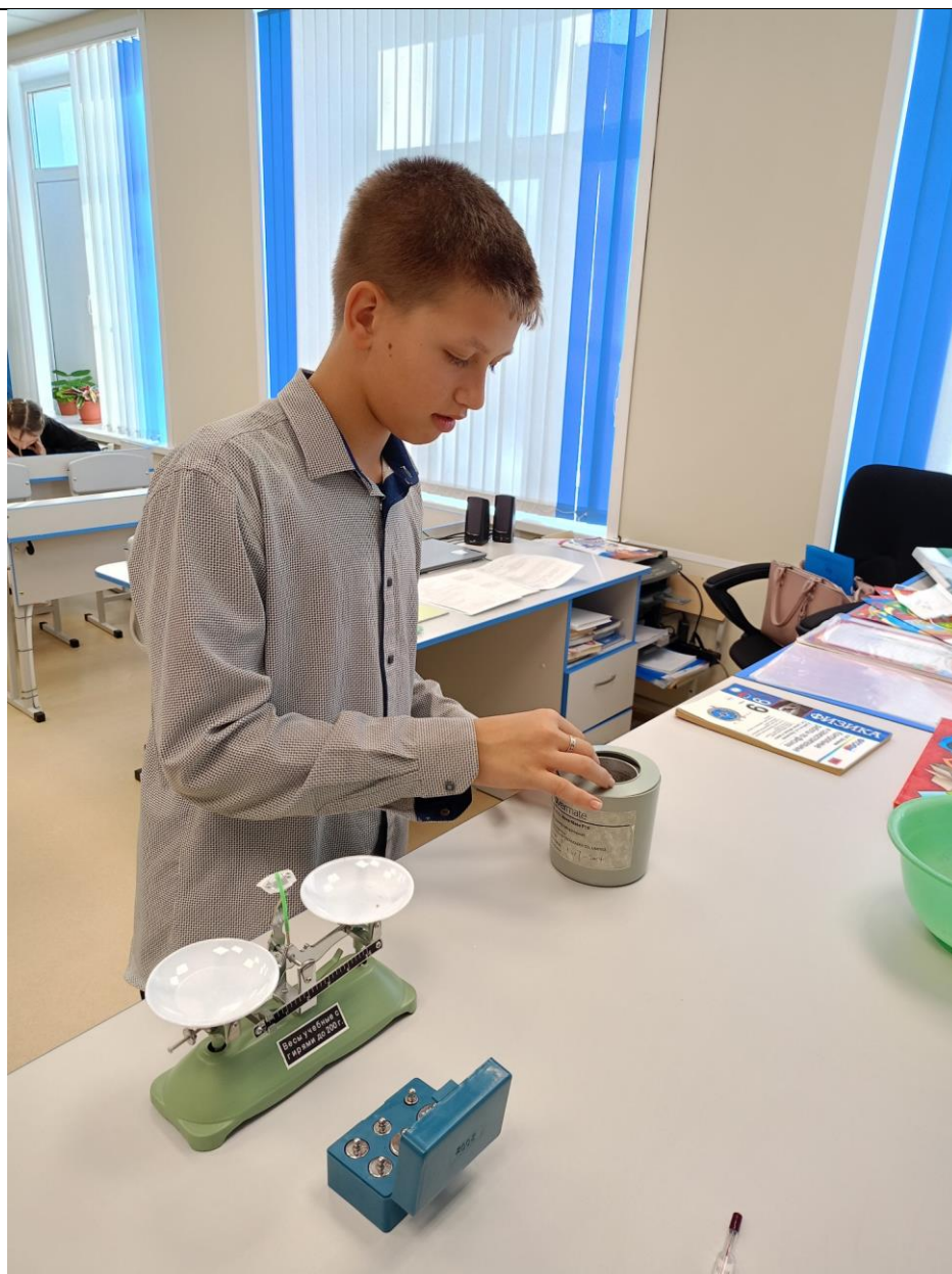
Определение удельной теплоемкости твердого тела